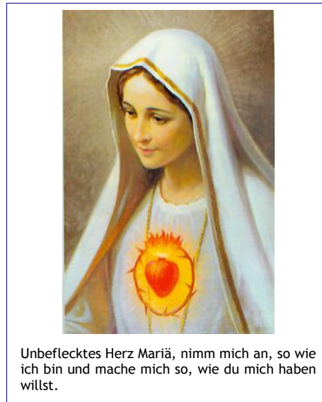
Unbeflecktes Herz Mariä, nimm mich an, so wie ich bin und mache mich so, wie du mich haben willst.